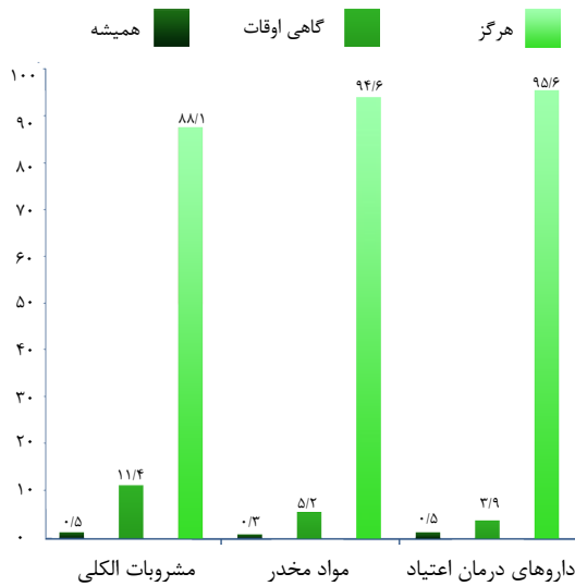
نمودار ۱. توزیع فراوانی سوء مصرف مواد مخدر، مشروبات الکلی و داروهای درمان اعتیاد در بین شرکت کنندگان در مطالعه

قصد مصرف مواد، ۴۶ نفر (۱۱/۹ درصد) سابقه مصرف مشروبات الکلی، ۲۱ نفر (۵/۴ درصد) سابقه مصرف مواد مخدر و ۱۰۲ نفر (۲۶/۲ درصد) مصرف مشروبات الکلی توسط دوستان را داشته اند. ۴۰ نفر (۱۰/۴ درصد) مصرف مواد مخدر و روانگردان توسط دوستان داشته اند، ۴۳ نفر (۱۱/۱ درصد) سابقه مصرف داروهای درمان اعتیاد توسط دوستان را داشته اند ( P=0/001 ) (جدول ۲).