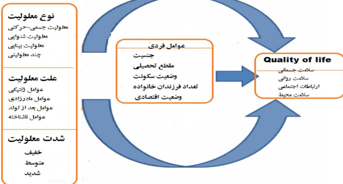
شکل ۱: تصویر مدل مبانی نظری و تجربی عوامل مؤثر بر کیفیت زندگی

پژوهش و شرکت در جلسات گوناگون اعضای رسمی، هماهنگی‌های لازم برای تنظیم زمان و تکمیل پرسش‌نامه انجام شد. ابزار استفاده‌شده در این پژوهش شامل پرسش‌نامه‌ی ثبت اطلاعات دموگرافیک و پرسش‌نامه‌ی کوتاه‌شده‌ی کیفیت زندگی سازمان بهداشت جهانی (WHOQOL-BREF 26) بود. این ابزار فرم خلاصه‌شده‌ی پرسش‌نامه‌ی کیفیت زندگی است که سازمان بهداشت جهانی آن را به‌عنوان ابزاری چندوجهی و چندزبانه برای ارزیابی کیفیت زندگی با قابلیت استفاده در فرهنگ‌های مختلف تدوین کرده است [۲۴].