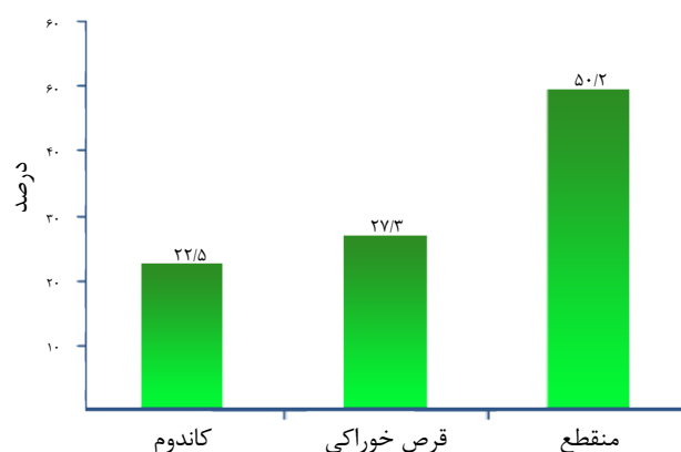
نمودار ۱. فراوانی روش های پیشگیری مورد استفاده در گروه حاملگی ناخواسته

با افزایش سن مادر در اولین حاملگی شیوع حاملگی ناخواسته کاهش یافت ( جدول ۱ ). شیوع حاملگی ناخواسته در افراد با سن اولین حاملگی زیر ۱۸ سال (۴۳/۲٪ حاملگی ناخواسته) بیشترین و در سن بیش از ۳۵ سال کمترین میزان (۰٪ حاملگی ناخواسته) گزارش شد و آزمون کای دو ارتباط معنی دار بین سن اولین حاملگی و حاملگی ناخواسته نشان داد ( P=0/02 ). میانگین سن ازدواج در جامعه مورد مطالعه 21/4 \pm 4/4 سال گزارش شد. با افزایش سن ازدواج مادران، شیوع حاملگی ناخواسته کاهش یافت. اما ارتباط بین سن ازدواج و حاملگی ناخواسته با استفاده از آزمون کای دو معنی دار نبود ( P=0/1 ). طبق جدول ۱ بیشترین حاملگی ناخواسته در افراد بیسواد (۶۰٪ حاملگی ناخواسته) گزارش شد و با افزایش سطح