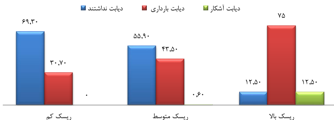
نمودار ۳: میزان شیوع دیابت بارداری به تفکیک گروه های در معرض خطر