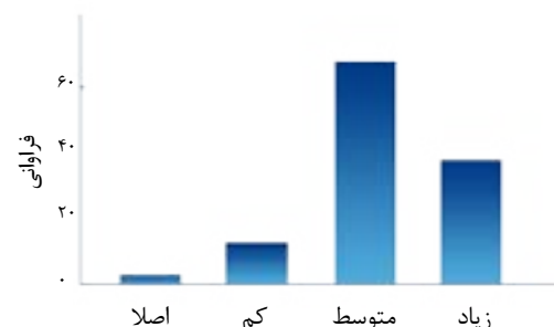
نمودار ۱. میزان رضایت بیماران از اجرای حاکمیت بالینی در بخش جراحی بیمارستان بعثت شهر همدان