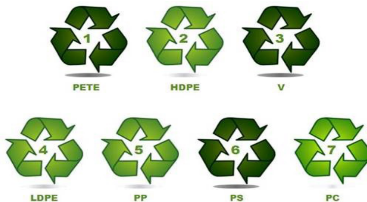
شکل ۱. راهنمای علائم مربوط به بازیافت پلاستیک های پلیمری [۱۳]

* هزینه های تلفن، برق، گاز و خرابی تجهیزات که ۱۰۰۰۰۰۰ تومان در ماه در نظر گرفته شده است.