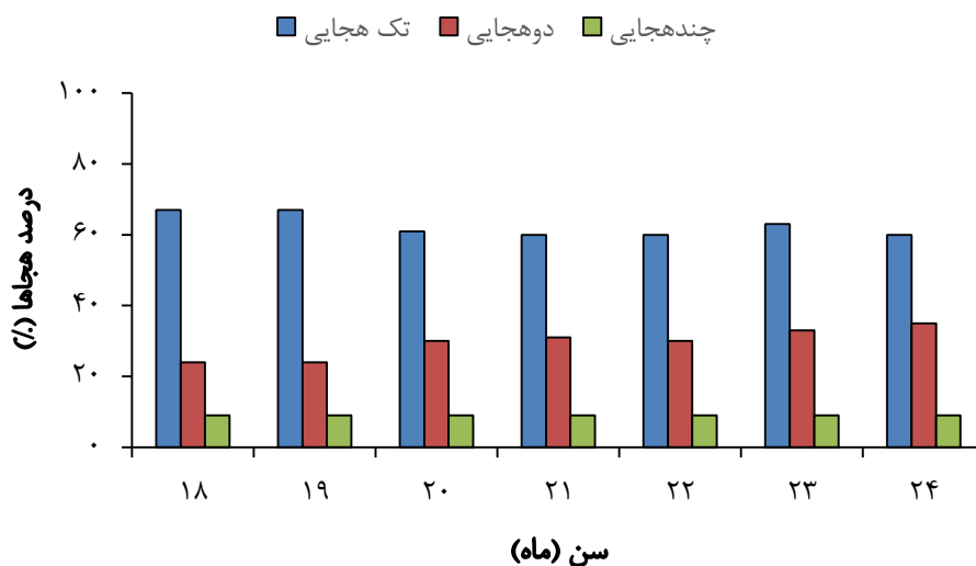
نمودار ۱: درصد تولید انواع هجا در هر ماه

در ۲ ماه اول (۱۸ و ۱۹ ماهگی) ۶۷٪ واژگان بیانی کودکان تک‌هجایی، ۲۴٪ دوهجایی و ۹٪ بیشتر از دوهجا بودند. ۳۲٪ از تک‌هجایی‌ها الگوی هجایی VC، ۲۸ درصد CV، ۳۶ درصد CVC و ۴ درصد CVCC داشتند. از واژگان دوهجایی هم ۵۲ درصد الگوی هجایی CVCV، ۱۵ درصد VCV، ۱۰ درصد CVCVC، ۱۰ درصد VCCV و ۱۳ درصد بقیه الگوها بودند. در ۲ ماه دوم (۲۰ و ۲۱ ماهگی) ۳۰ درصد از تک‌هجایی‌ها الگوی هجایی VC، ۳۰ درصد CV، ۳۰ درصد CVC و ۴ درصد CVCC داشتند. از واژگان دوهجایی هم ۵۰ درصد الگوی هجایی CVCV، ۱۷ درصد VCV، ۱۰ درصد CVCVC، ۱۰ درصد VCCV و ۱۳ درصد بقیه الگوها بودند. در ۳ ماه سوم (۲۲ و ۲۳ ماهگی) ۲۰ درصد از تک‌هجایی‌ها الگوی هجایی VC، ۳۰ درصد CV، ۳۵ درصد CVC و ۱۰ درصد CVCC داشتند. از واژگان دوهجایی هم ۴۵٪ الگوی هجایی CVCV، ۲۰ درصد